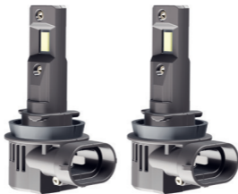
Автомобильные светодиодные лампы