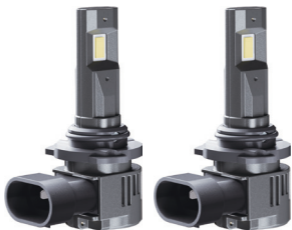
Автомобильные светодиодные лампы