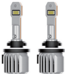
Автомобильные светодиодные лампы