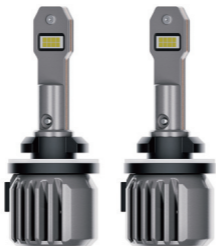
Автомобильные светодиодные лампы