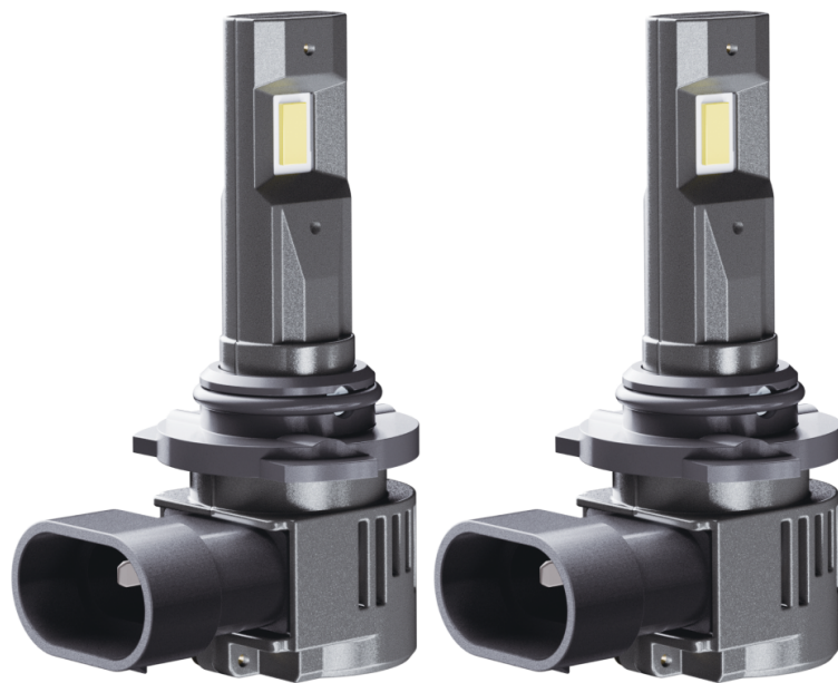
Автомобильные светодиодные лампы