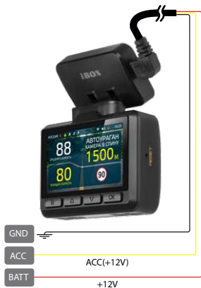
Схема подключения кабеля питания к бортовой сети автомобиля iBOX 24H Parking monitoring cord micro USB D1:

Кабель питания iBOX 24H Parking monitoring cord micro USB D1 позволяет не допустить критической разрядки аккумулятора автомобиля. В каком бы режиме ни работал видеорегистратор, кабель автоматически отключает его питание, при падении напряжения ниже 11,8 В для аккумуляторов с напряжением 12 В и ниже 23,4 В для аккумуляторов с напряжением 24 В.